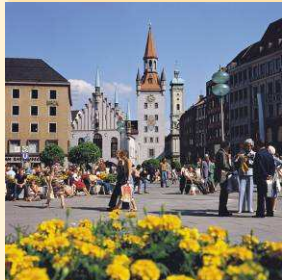
Marienplatz Munich

Entsprechend unserer Erfahrung und zur Zufriedenheit der Gäste sollte die Gruppenstärke bei integrierten Rundgängen 30 Personen nicht übersteigen. In ausgewählten Destinationen liegt die maximale Gruppengröße für Stadtführungen bei 20 oder 25 Personen.