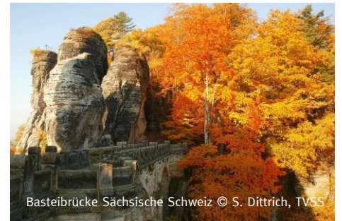
Basteibrücke Sächsische Schweiz

Die Beförderung erfolgt zwischen 9 bis 17 Uhr (maximal 2 Gepäckstücke pro Person mit max. 20 kg pro Gepäckstück). Das Gepäck muss mit Kofferanhängern von AugustusTours gekennzeichnet sein. Der Transport von Sondergepäck (Kinderwagen etc) ist nur auf Anfrage möglich. Laptops, Sperrgut und andere zerbrechliche Gegenstände werden nicht befördert! Das Gepäck wird nicht befördert, wenn der Gast abweichend der genannten Regelungen Gepäck bereitstellt oder trotz Aufforderung zur Reduktion das Maximalgewicht von 20 kg pro Gepäckstück nicht einhält.