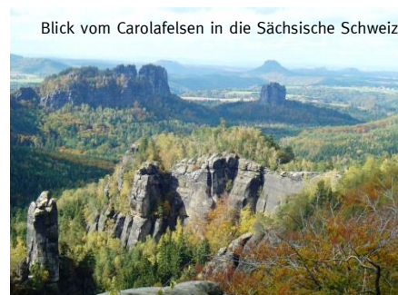
Blick vom Carolafelsen in die Sächsische Schweiz