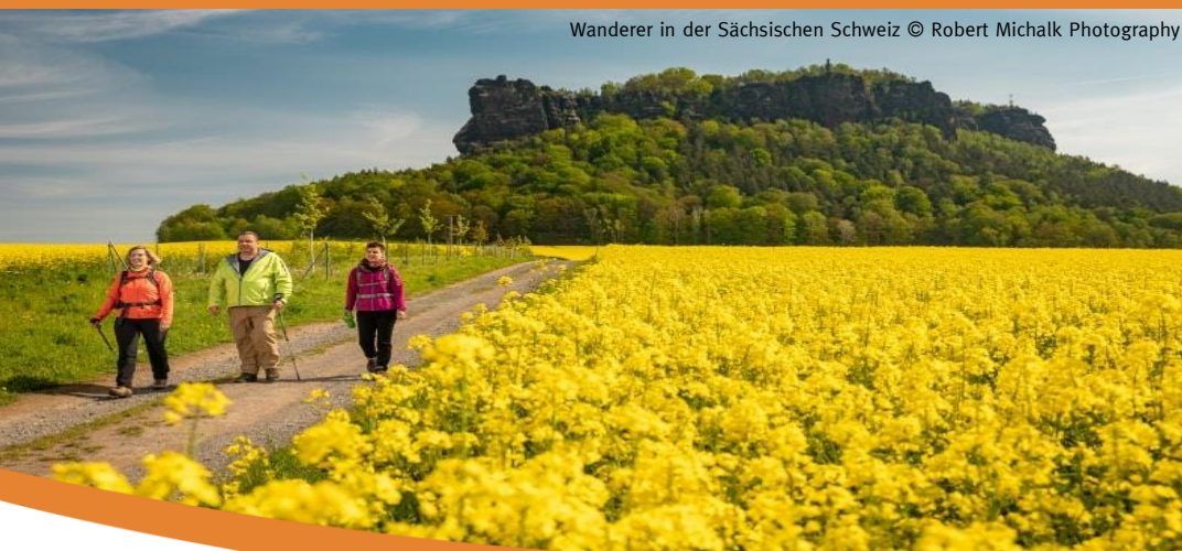
Wanderer in der Sächsischen Schweiz