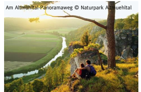
Am Altmühltal-Panoramaweg