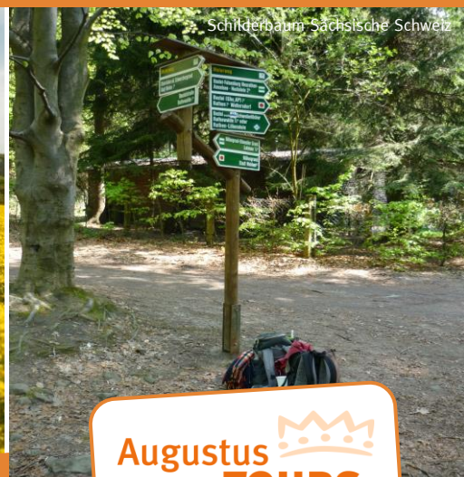
Schilderbaum Sächsische Schweiz