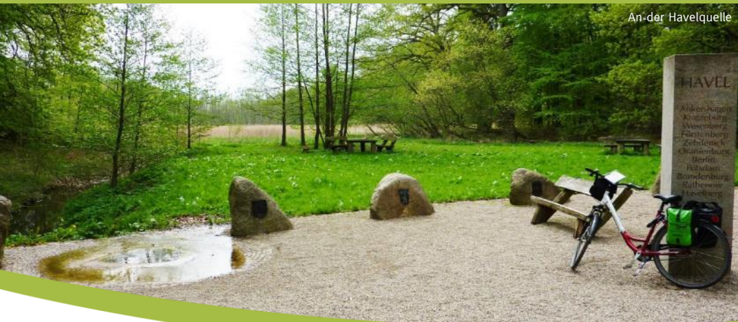
An der Havelquelle