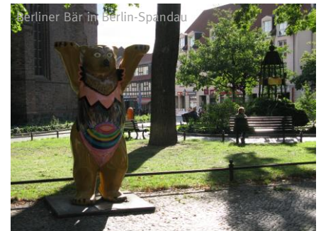
Berliner Bär in Berlin-Spandau

6. Tag: Zehdenick – Oranienburg (ca. 36 km) Vorbei an Liebenwalde mit seiner Stadtkirche und der Burgruine geht es nach Oranienburg, der Stadt im Norden von Berlin. Hier laden Schloss Oranienburg und Nicolaikirche, die Wahrzeichen der Stadt, zum Verweilen ein.