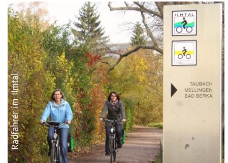
Radfahrer im Ilmtal

Auf dieser Etappe radeln Sie in Richtung Bad Kösen mit seinem bekannten Gradierwerk. Ab Kleinheringen folgen Sie der Ilm in Richtung Bad Sulza bis in das Etappenziel, die Glockenstadt Apolda.